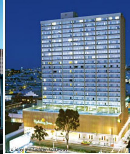
Holiday Inn Golden Gateway