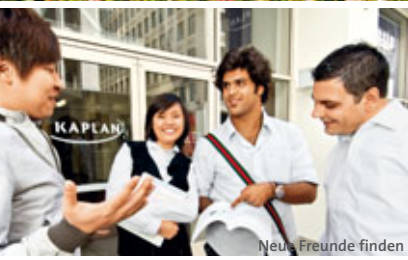
Neue Freunde finden