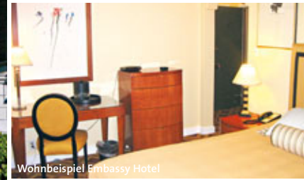
Wohnbeispiel Embassy Hotel