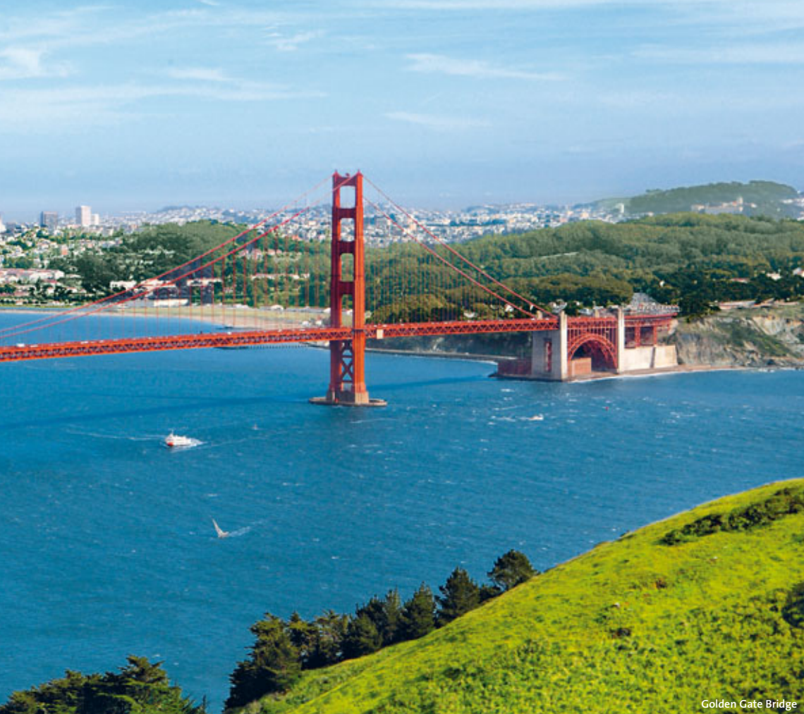
Golden Gate Bridge