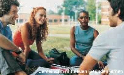
Gemeinsam mit neuen Freunden lernen